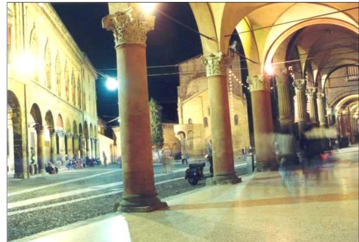
Bologna - uno scorcio dei famosi portici

Informazioni, programmi, attività, a cura del Movimento Adulti Scouts Cattolici Pratesi - Piazza Mercatale 149, Prato - Stampato in proprio www.masciprato.com