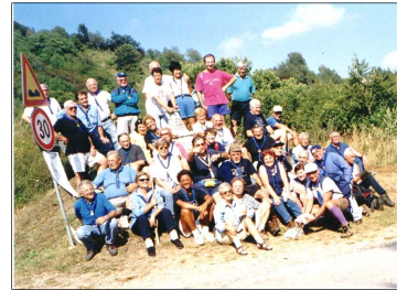
Un vecchio campo reg.le all'Alpe

"Juno" che affronta il grave ed attuale problema della gravidanza di ragazze ancora adolescenti (10 mila casi all'anno in ragazze fra i 14 ed i 18 anni in Italia). Alle proiezioni è seguita la discussione fra noi.