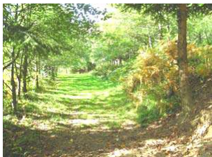
Un sentiero per l'Alpe