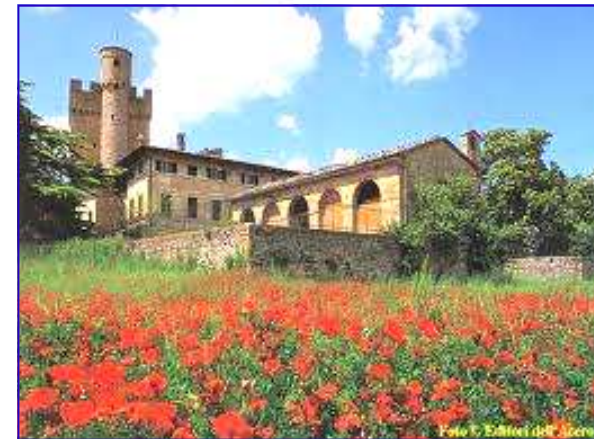
L'Eremo di Lecceto a Malmantile

Informazioni, programmi, attività, a cura del Movimento Adulti Scouts Cattolici Pratesi - Piazza Mercatale 149, Prato - Stampato in proprio www.masciprato.com