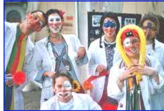
Medici e volontari clown al Meyer di Firenze

Vuoi vivere di più? Aiuta gli altri e fallo con sincerità d'animo. Secondo un nuovo studio pubblicato sulla rivista Health Psychology , infatti, i volontari che aiutano gli altri vivono più a lungo, tanto più a lungo quanto più intense e altruistiche sono le ragioni che li sostengono in questa loro attività.