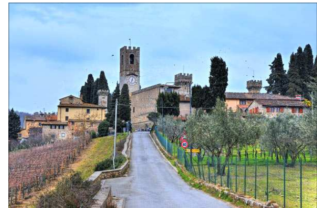
La Badia di Passignano, meta della nostra uscita di novembre

Informazioni, programmi, attività, a cura del Movimento Adulti Scouts Cattolici Pratesi - Piazza Mercatale 149, Prato - Stampato in proprio www.masciprato.com