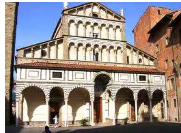
La Cattedrale di San Zeno a Pistoia

Informazioni, programmi, attività, a cura del Movimento Adulti Scouts Cattolici Pratesi - Piazza Mercatale 149, Prato - Stampato in proprio www.masciprato.com