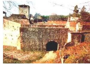
Pistoia - la fortezza Santa Barbara