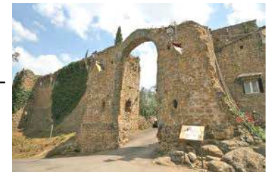
Il castello diroccato di Malmantile

Il tema delle meditazioni, che ci proporrà il nostro Assistente P. Gino, verterà sulla lotta spirituale del cristiano per vincere le tentazioni. Il tema è suggerito dal Vangelo della 1ª domenica di Quaresima, (Mt 4, 1-11), che tratta dello scontro vittorioso di Cristo sul maligno e il suo fedele «sì» alla volontà del Padre. Gesù - che nel battesimo al Giordano è stato manifestato dal Padre come «Figlio diletto» (cf Mt 3,17) - subito dopo viene condotto dallo Spirito nel deserto per essere tentato.