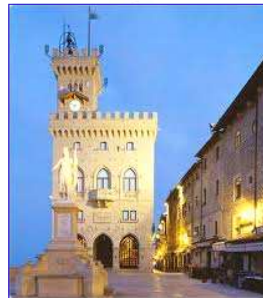
San Marino - un'antica repubblica nel centro d'Italia

Informazioni, programmi, attività, a cura del Movimento Adulti Scouts Cattolici Pratesi - Piazza Mercatale 149, Prato - Stampato in proprio www.masciprato.com