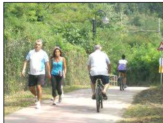
Sulla nostra pista ciclo-pedonale

Informazioni, programmi, attività, a cura del Movimento Adulti Scouts Cattolici Pratesi - Piazza Mercatale 149, Prato - Stampato in proprio www.masciprato.com