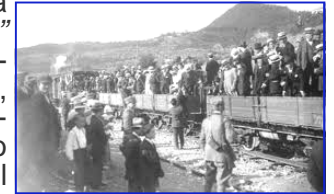
La Direttissima Foto del 1921

Sarà una occasione per osservare ancora una volta "la valle onde Bisenzio si dichina" ( Inferno, Canto XXXII ) e camminando, chiacchierare piacevolmente fra noi di tante cose, anche della ferrovia direttissima Firenze-Prato-Bologna, che corre a fianco del Bisenzio e della ciclabile. La direttissima fu inaugurata il 22 aprile 1934.. La linea nacque moderna, a doppio binario con trazione elettrica, e necessario di opere molto complesse da realizzare, come la galleria dell'Appennino lunga 18.5 km, la seconda al mondo per lunghezza all'epoca, che richiese 11 anni di lavoro.