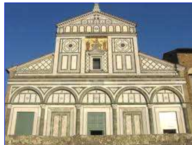
La splendida facciata della chiesa di San Miniato al Monte di Firenze

Informazioni, programmi, attività, a cura del Movimento Adulti Scouts Cattolici Pratesi - Piazza Mercatale 149, Prato - Stampato in proprio www.masciprato.com